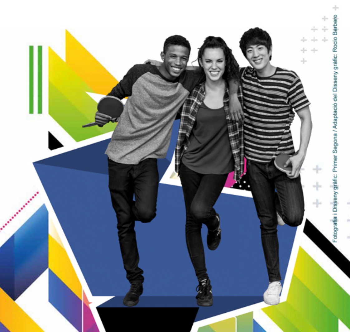
Fotografia i Disseny gràfic: Primer Segona / Adaptació del Disseny gràfic: Rocio Barbero

Programa de prevenció selectiva del consum d'alcohol i cànnabis en joves