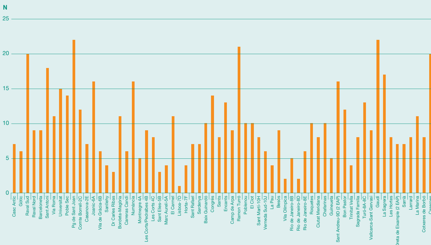
Figura 2. Distribució dels casos notificats segons centre notificador. Barcelona, 2017.

El 100% dels EAP de Barcelona van notificar almenys un cas de malaltia relacionada amb el treball.