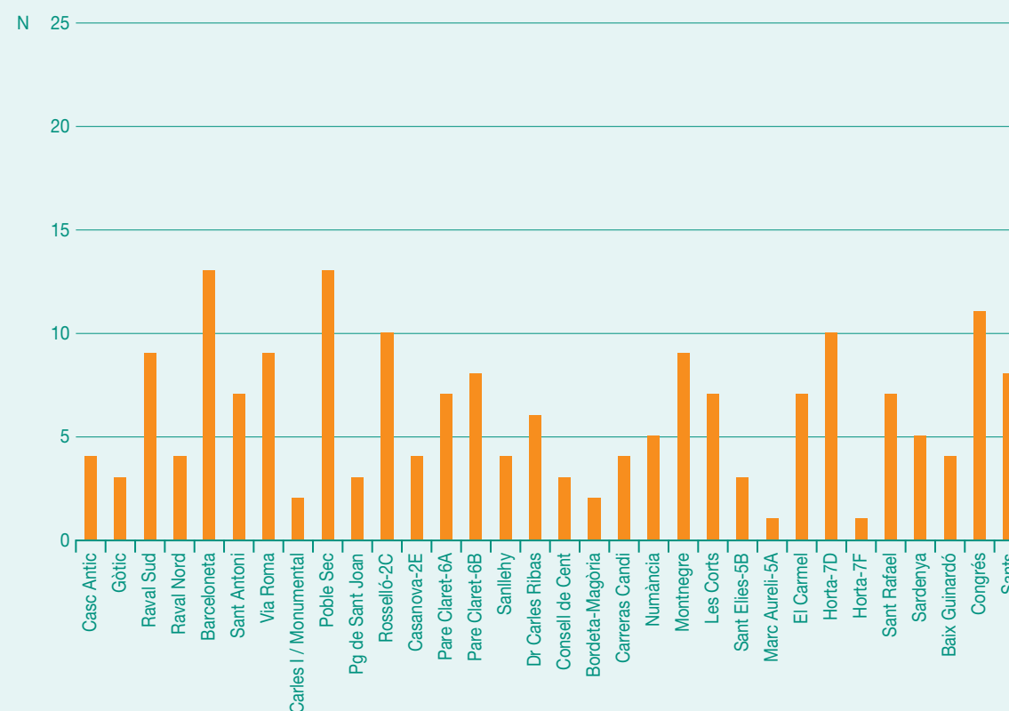
Figura 3. Distribució dels casos notificats segons centre notificador. Barcelona, 2012.

Van augmentar els trastorns musculesquelètics en les dones i en les ocupacions no manuals i van disminuir els trastorns de tipus mental de manera generalitzada. Tot i així els diagnòstics més freqüents van seguir sent els trastorns ansiós-depressius